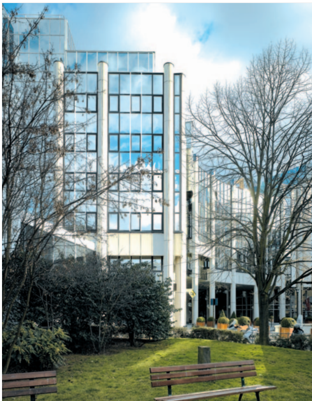
7, place René Clair • Boulogne Billancourt (92)